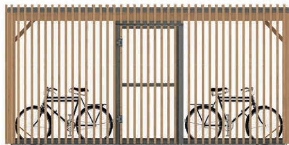
Abri version simple