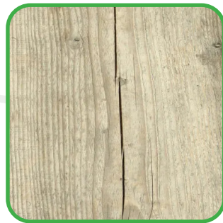
Fentes et microfissures

Les pièces de bois peuvent présenter des nuances différentes, qui s'harmonisent avec le temps.