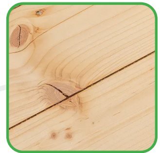
Nœuds et singularités

De petites fissures superficielles peuvent apparaître, sans impact sur la stabilité de l'abri.