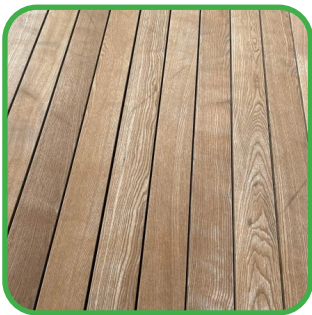
Variations de teinte / veinage

Toutefois, comme tout matériau naturel, il peut évoluer sous l'effet des conditions climatiques et de son environnement. Ces transformations sont normales et n'altèrent en rien la solidité, ni la fonctionnalité du produit. Choisir le bois, c'est accepter ses caractéristiques.