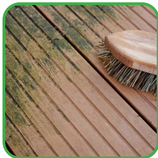
Mousses de surface

Les nœuds font partie du caractère naturel du bois et n'altèrent aucunement sa résistance.