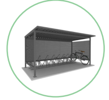
Abri Zéphyr habillage tôles perforées