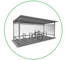
Abri Zéphyr habillage verre