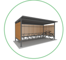
Abri Zéphyr habillage bois