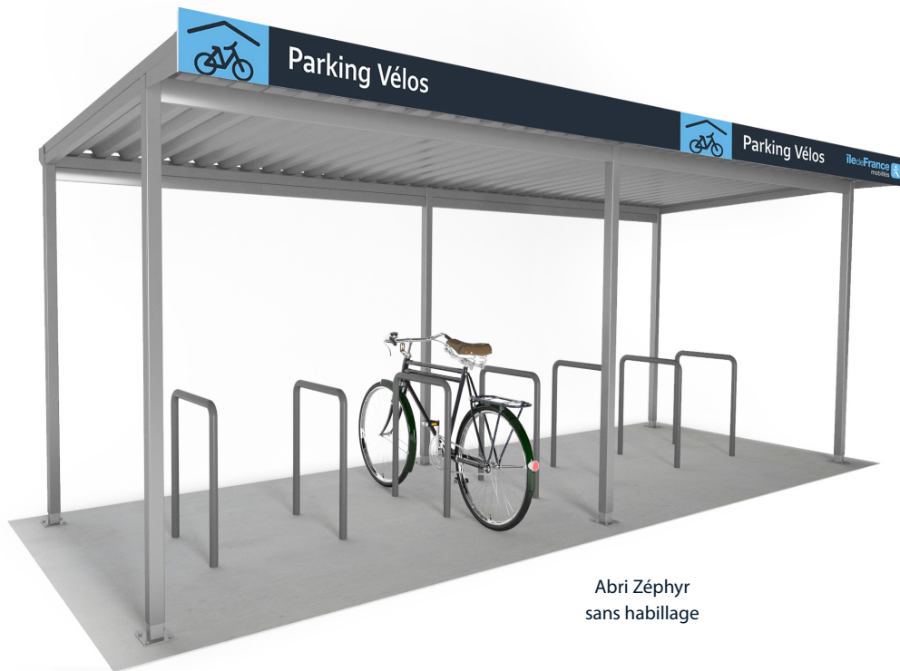
Abri Zéphyr sans habillage